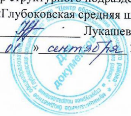
График проведения оценочных процедур структурное подразделение «Глубоковская средняя школа» I полугодие 2023-2024 учебный год.